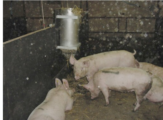
Distributeur de paille

Une étude portant sur un système au caillebotis partiel faisait état d'un distributeur composé d'un tube en métal (hauteur : 77,0 cm ; diamètre : 29,0 cm) équipé d'une corbeille en cote de mailles située en dessous (hauteur : 17,0 cm). Le distributeur était fixé sur la paroi du compartiment, à environ 3,0 m loin de l'avant du compartiment, pour que la corbeille en cote de mailles soit à la hauteur de la tête des porcs. Le distributeur était rempli de paille longue que les porcs pouvaient fouiller et tirer à travers la cote de mailles. Un plateau métallique (57,5 cm x 56,0 cm ; bordure de 4 cm) fixé sur la paroi du compartiment, au niveau du sol, en dessous du distributeur, recueillait la paille qui tombait.