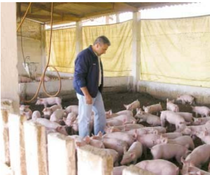
Des porcelets sevrés sur coques d'arachide au Brésil