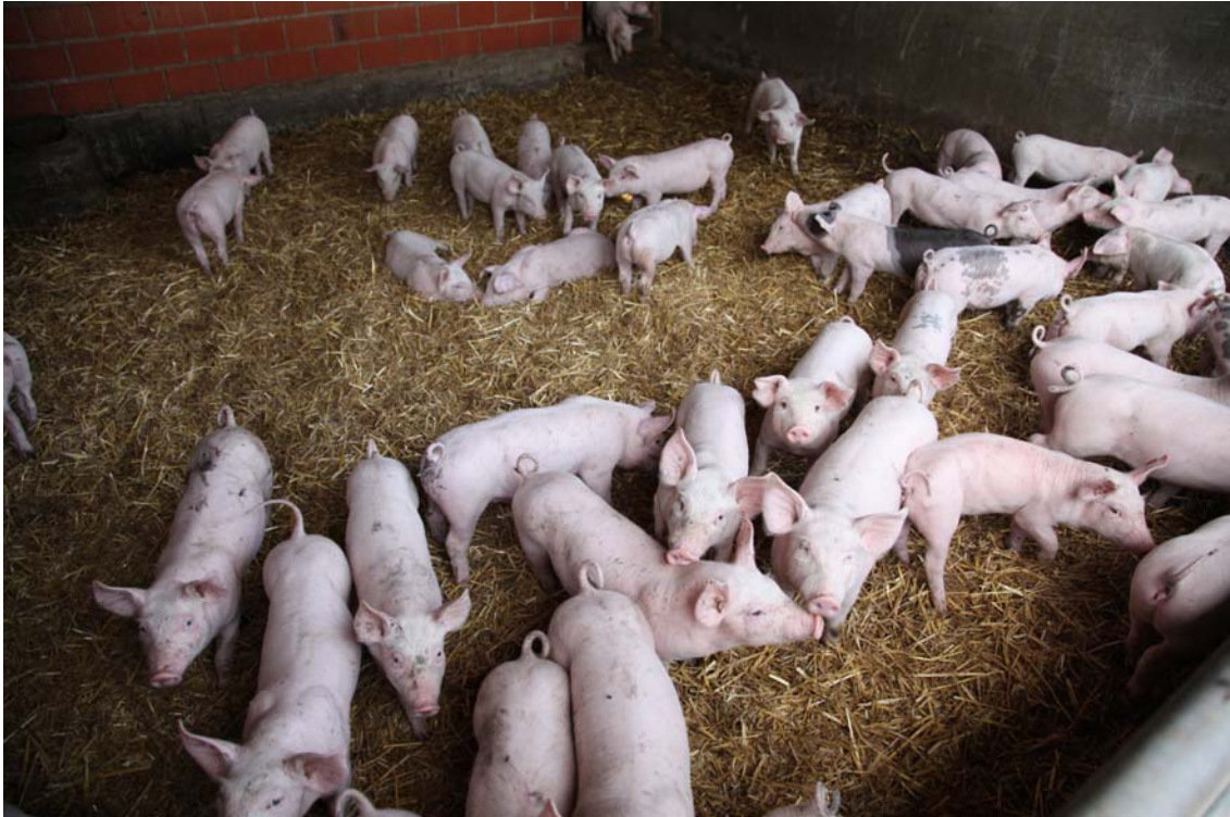
Une ferme française

http://www.europeanfarmersnetwork.org/files/efn/documents/case_studies_1_0.pdf