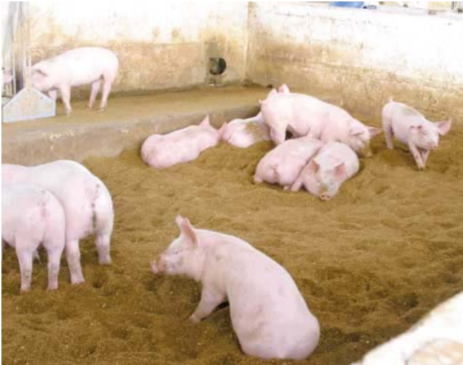
L'élevage de porcs sur une litière épaisse au Brésil

Au sud du Brésil, un certain nombre d'exploitations où les températures sont relativement élevées utilisent des litières à base de coques d'arachide, de balles de riz ou de bois pulvérisé. Souvent, les porcs sont logés dans des bâtiments à pans ouverts munis de rideaux.